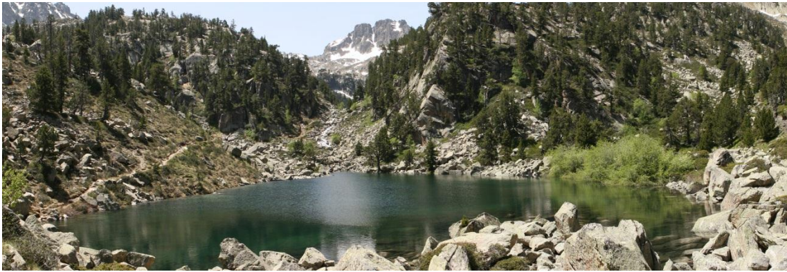
Estany del Gerber

encerclat per les muntanyes properes i a on la vegetació ja comença ser escassa. La pedra predomina fortament i només uns pocs exemplars de pi roig creixent tossudament entre roques.