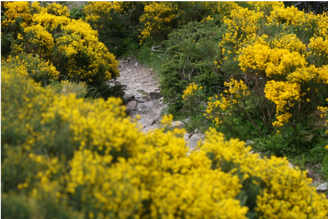
Camí envoltat d'escombres o ginesta