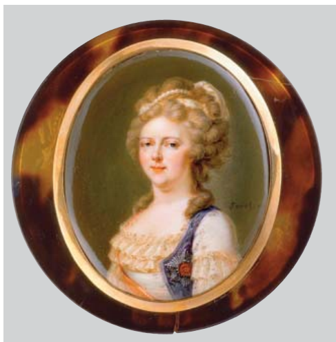
33 СОРЕ (SORET), НИКОЛЯ (1759–1830)