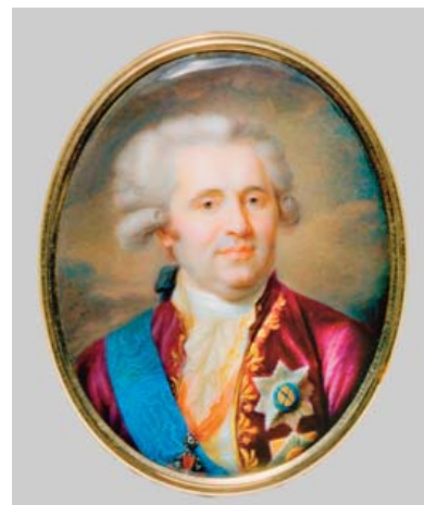
34 СОРЕ (SORET), НИКОЛЯ (1759–1830)

Происхождение: собрание Галины Вишневской и Мстислава Ростроповича.