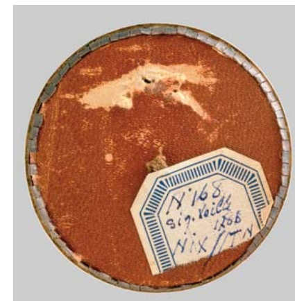
26 ВУАЛЬ (VOILLE), ЖАН ЛУИ (1744 – НЕ РАНЕЕ 1806)

Французский живописец-портретист, миниатюрист. Учился в Париже у Ф.-Ю. Друэ. В 1770–1772, 1774–1776, 1785–1793 и 1801–1803 работал в России. В 1788 получил от петербургской Академии художеств звание «назначенного». Автор многочисленных портретов представителей российской императорской фамилии и петербургской аристократии.