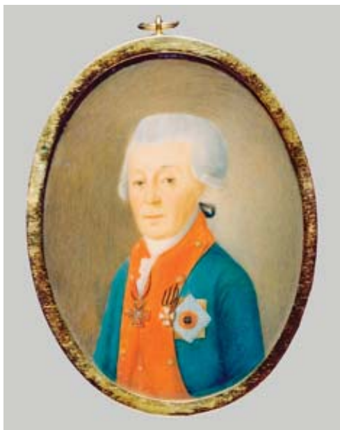
51 НЕИЗВЕСТНЫЙ ХУДОЖНИК ПОРТРЕТ НЕИЗВЕСТНОГО ГЕОРГИЕВСКОГО КАВАЛЕРА

1780-е – первая половина 1790-х Кость, акварель, гуашь. 8×6 (овал)