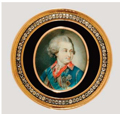
25 ВИОЛЛЕ (VIOLLIER), АНРИ-ФРАНСУА-ГАБРИЕЛЬ (1750–1829) ПОРТРЕТ СВЕТАЙШЕГО КНЯЗЯ Г.А.ПОТЕМКИНА-ТАВРИЧЕСКОГО

Первая половина 1790-х Кость, акварель, гуашь. 4,8×4 (овал) Портрет вмонтирован в крышку черепаховой табакерки Тип Иоганна Баптиста Лампи Старшего (Lampi) (1751–1830).