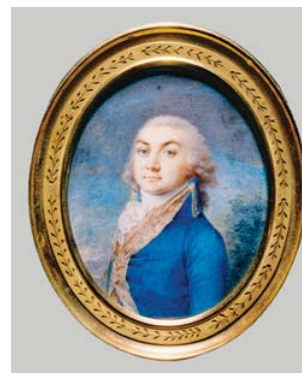
52 НЕИЗВЕСТНЫЙ ХУДОЖНИК ПОРТРЕТ НЕИЗВЕСТНОГО ГЕОРГИЕВСКОГО КАВАЛЕРА

Происхождение: собрание Галины Вишневской и Мстислава Ростроповича.