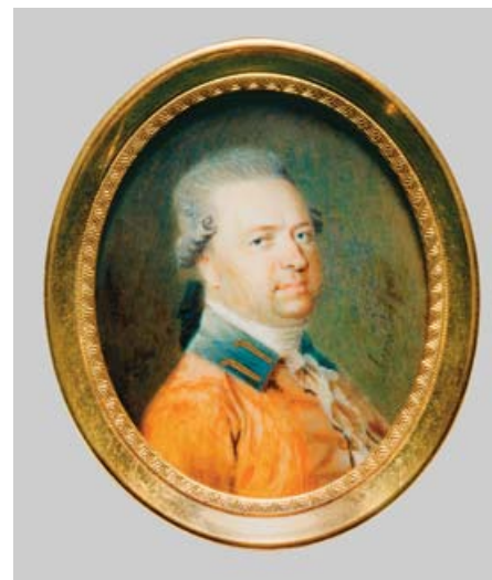
36 ХОРНОНГ (HORNONG) (ВТОРАЯ ПОЛОВИНА XVIII ВЕКА)

Литература: L. Schidlof. The Miniature in Europe. Graz, 1964, vol. 1, p. 267, ill. 424.