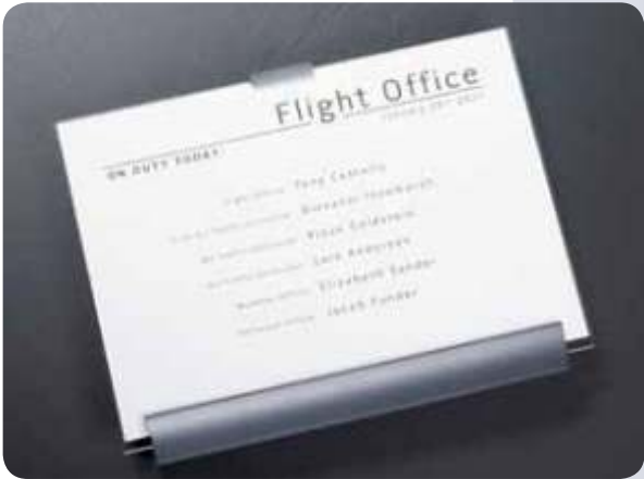
Macer Interior paperflex