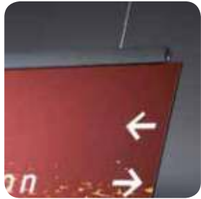
Señal proyectada de Macer cristal