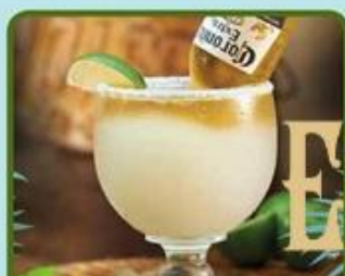
CORONARITA (52cl) 12.90€ Une bière Corona flottant dans notre Margarita glacée !