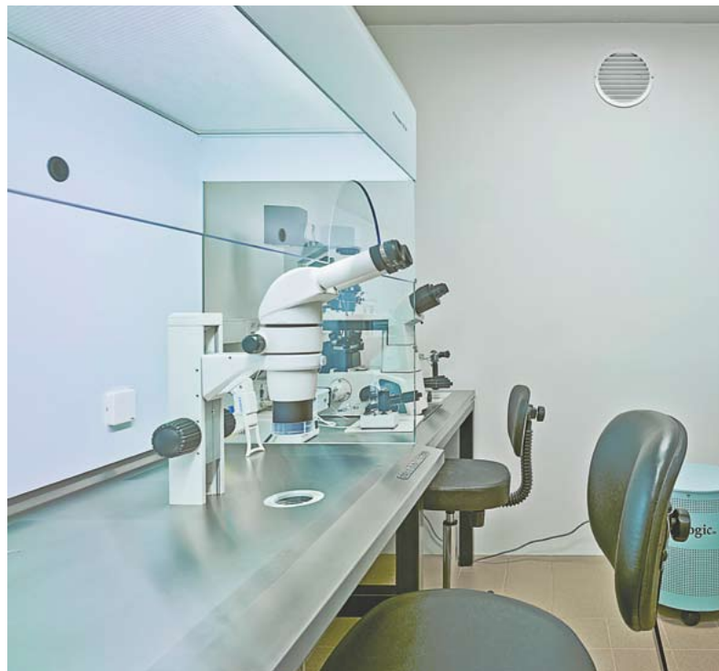
Laboratorio de una de las sedes que tiene la Clínica IMAR en la ciudad de Murcia.

Clínica IMAR aplica en la Región de Murcia las tecnologías más innovadoras