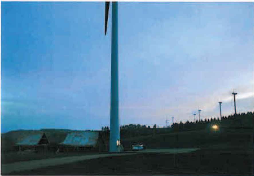
CRÉPUSCULE VROM-BISSANT Au Lévézou, près du parc éolien. Au premier plan, un aérogénérateur en maintenance.

“On se donne rendez-vous dans deux-trois ans, vous serez content d’avoir eu un prêtre qui a dit non !”