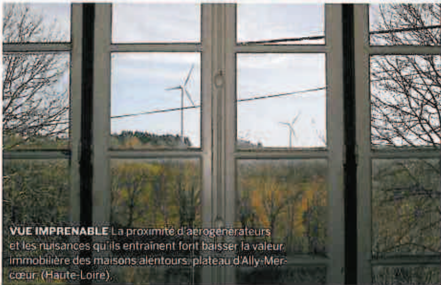
VUE IMPRENABLE La proximité d'aérogénérateurs et les nuisances qu'ils entraînent font baisser la valeur immobilière des maisons alentours, plateau d'Ally-Mercœur (Haute-Loire).