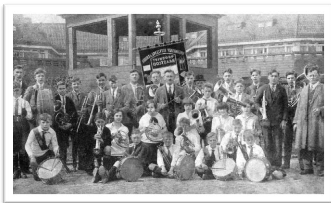
Speeltuinvereniging en fanfare gaan goed samen. Jonge aanwas van de harmonie Tuindorp Oostzaan voor de muziktent op het Zonneplein (1925).

Muziektenten en het verenigingsleven waren sterk met elkaar verbonden. Inmiddels kwamen er ook muziekkiosken op een aantal volkstuincomplexen en op speelterreinen in de stad. Zo kregen de Noorder- en Westerspeeltuin op respectievelijk het Karthuizerplantsoen en het J.J. Cremerplein en Speeldistrict V van het Hendrick de Keyzerplein een eigen muziktent. Van al deze speelplekken werd