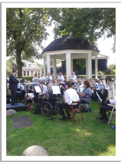
Harmonie Tuindorp Oostzaan in Schellingwoude tijdens het festival 'Blaas de Muziekkapel Nieuw Leven in!', georganiseerd door de Stichting Muziekkapellen. Ook in de muziekkiosken van Durgerdam en Ransdorp werd gespeeld. Het publiek ging van dorp naar dorp om naar de concerten te luisteren (22 augustus 2015).

In het begin van de twintigste eeuw, op het hoogtepunt van de Amsterdamse muziektentencultuur, stonden er ruim twintig op de meest uiteenlopende locaties: in parken, in (volks)tuinen, op pleinen en bij uitspanningen. De meeste muziekkiosken zijn er niet meer. De zes tenten die nog bestaan, worden nu gekoesterd. Ze zijn gerestaureerd, worden onderhouden en gebruikt en zijn erkende monumenten.