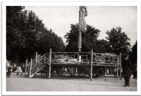
Uitgevouwen muziektent op het Frederik Hendrikplantsoen (1913). Ontwerp van dhr. Wijnands hoofdopzichter bij de Gemeentewerkplaatsen. Het onderstel van de wagen, waarmee de tent werd vervoerd, diende ter ondersteuning van het podium.

dankbaar gebruik gemaakt. Amsterdam kende een actief muziekleven en het grote aantal plaatselijke muziekkorpsen was hier een levend bewijs van. Bedrijven, fabrieken, en instellingen en afdelingen van de gemeente, waaronder ook de afdeling Publieke Werken, hadden allen een eigen muziekkorps! Op hoogtijdagen, zoals bijvoorbeeld regeringsjubilea, een Rembrandtjaar, 650 jaar stad Amsterdam, en bevrijdingsfeesten, traden zij op. Men organiseerde marsen door de stad en op pleinen en in parken gaf men uitvoeringen. Daar waar geen vaste muziektent stond kwam er een mobiel, uitvouwbaar exemplaar, geleverd door de gemeente. Deze werden vanaf het begin van de twintigste eeuw in de Gemeentelijke Werkplaats aan de Van Reigersbergerstraat, die een aparte timmerafdeling had, ontworpen, gebouwd, onderhouden en uitgeleend.