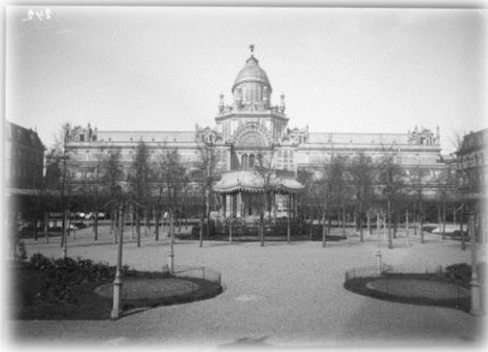
Muziekkiosk in de tuin van het Paleis voor Volksvlijt rond 1883, ontworpen door Cornelis Outshoorn. Tuin en muziektent kwamen een jaar na het paleis gereed in 1865. Toen het Volkspaleis in 1929 geheel afbrandde, betekende dit waarschijnlijk ook het einde van de kiosk.