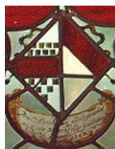
Wapen van Alverade van Windelnesse