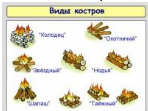
Рисунок 1. Види багаття.

Учасник обирає одну картку та складає зазначений на ній вид багаття. В разі, якщо багаття було складене вірно, однак одразу рухнуло, учасник має його скласти спочатку.