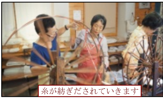
糸が紡ぎだされていきます

太くなったり 細くなったり 切れてしまったり 汗をかきながら みなさん真剣に取り組まれています。 生亀先生曰く コツは、自分を出さないこと。