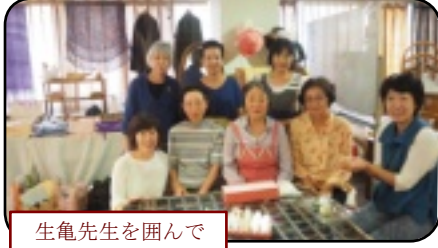
生亀先生を囲んで