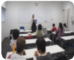
10/9練馬のつどいの様子