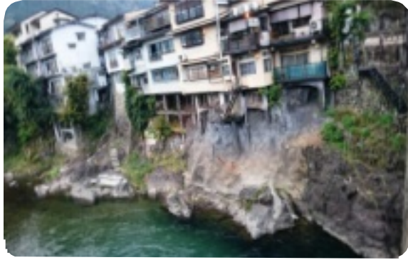
岐阜 郡上八幡の名勝地 10月22日つどいにて

「生きていく」 十月二十九日の夜9時から のNHKで百歳を超えてからの ことを放映してました。ゲ ストに日野原医師(一〇五 歳)が出てました この番組の中で、一〇〇歳 を超えてしまうと老いの不 安がすべて消えて、毎日が 心豊かな日々変わったと 話されていきました。 そんなことがあるのかな と感じ入ってしまいました。 この日の昼は、綿畑の収穫 祭を行い終わった後で(五〇 人の仲間が畑につどい 大 盛況でした) 気持ち良い疲 れがありました。