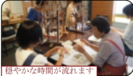
穏やかな時間が流れます