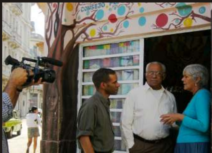
Momento del rodaje en una calle de La Habana, Cuba.

Hablar de Eduardo Rosillo en Cuba es hablar de lo popular, es hablar de programas de radio tan queridos por los cubanos como: "La Discoteca Popular", "Un Domingo con Rosillo" o el show radial "Alegrías de Sobremesa". Una parte de la memoria de la radio cubana que ha intentado recoger el documental " Rosillo, gracias a la radio ", con la colaboración de la productora de documentales de la Unión Nacional de Escritores y Artistas de Cuba (UNEAC), y a su fundador, el fallecido cineasta Octavio Cortázar.